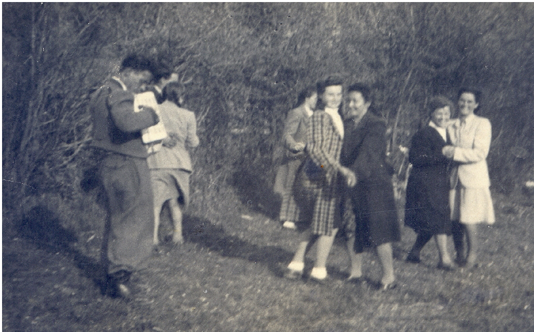
Schöne Unterhaltung, auch ohne Disco und ohne Geld. Kurtiniger Jugendliche auf einem improvisierten Wiesenfest (1943)

Ich selbst bin in den Vinschgau gekommen, und zwar in einen Bauernhof oberhalb von Laas/Tarnell. Im Stiegerhof mußte ich allerdings bei der Wirtschaft mithelfen. Es war aber trotzdem schön, ich konnte so manches dazulernen und mich mit netten Menschen anfreunden, mit denen ich auch heute noch Kontakte habe. Es wurden in dieser Zeit in verschiedenen Orten auch dreiwöchige Kurse abgehalten; zum Beispiel in Unterradein oder in der Nähe des Sel-lapasses, im Haus Hillebrand. Dort war auch ich; man mußte ein Schulungspro-