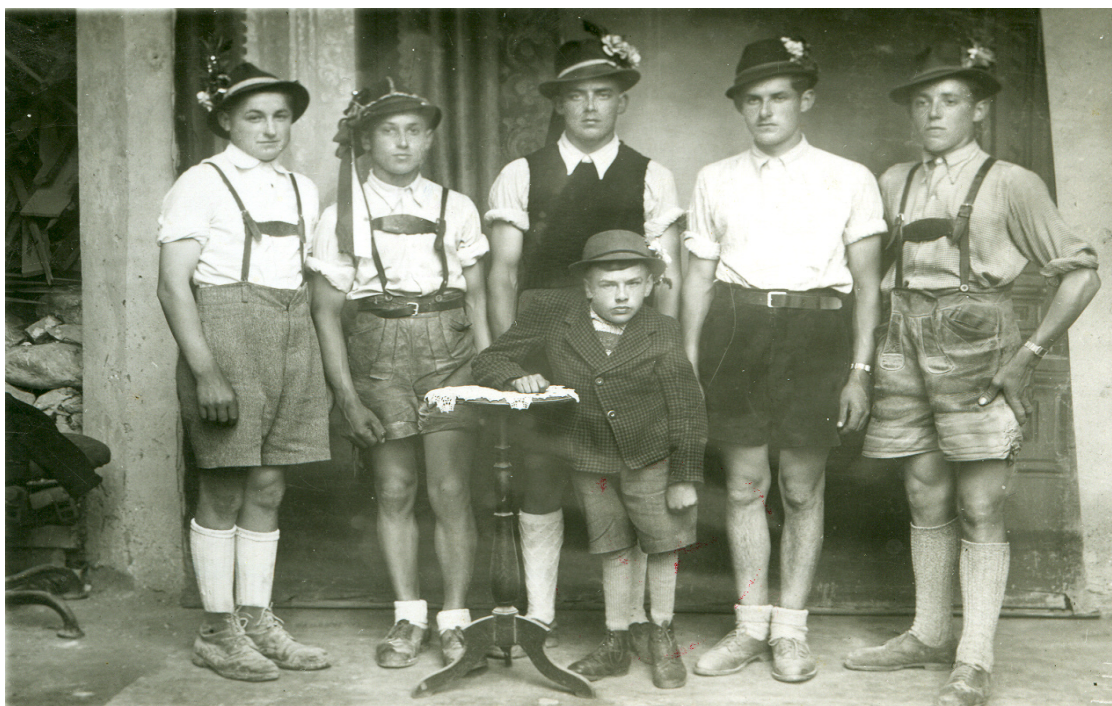
Kurtiniger Jugendliche der Jahrgänge 1926 und 1927 vor der Musterung.

Die Anzeige konnte nicht mehr zurückgezogen werden. Obwohl der Richter unser »Vergehen« als harmlos bezeichnete, waren wir »gezeichnet«. Es dauerte nicht lange, und wir wurden zum Militärdienst einberufen.