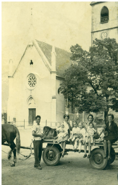
...bis zum Pferdewagen

Ich konnte und wollte das nicht länger mitansehen und bildete mit anderen Dorffreunden eine unabhängige Liste.