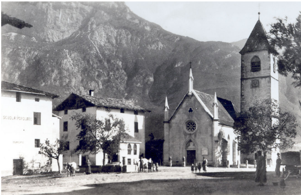
Der alte Dorfplatz in Kurtinig

M eine Kinder und Enkelkinder haben mich oft gebeten, die Geschichte meines Lebens zu erzählen: von meiner Jugend, dem Krieg, meinen Erfahrungen in der Gemeindepolitik. Dies will ich jetzt machen, auch wenn ich kaum Erfahrung mit dem Schreiben habe. Wie viele andere Südtiroler aus meiner Generation wurde ich als Kind gezwungen, die italienische Schule zu besuchen; Deutsch schreiben lernten wir in den sogenannten »Katakombenschulen« unter prekären Bedingungen. Trotzdem will ich versuchen, einige Episoden aus meiner Vergangenheit zu erzählen, so wie sie mir immer wieder in Erinnerung kommen.